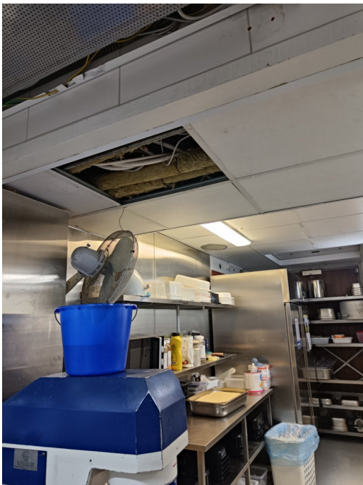
Vuotokohta keittiössä. Henkilökunta on asettanut ämpäriin keräämään vuotovettä